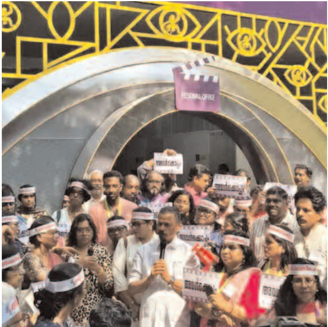
మద్దతే తన బలమని ఆమె ప్రకటించడం, ఈ పోరాటానికి కొత్త ఉత్సాహాన్ని ఇచ్చింది.

2017లో బాధితురాలు ధైర్యంగా పోలీసులను ఆశ్రయించిన క్షణం నుంచే, ఆమెకు లభించిన ఈ సంఘీభావమే ఈ కేసుపై కమ్యూనికేషన్ లీకేజీలో ఆశాకిరణంగా నిలిచింది. పరిశ్రమలో పాతుకపోయిన మౌన సంస్కృతిని చెరిపేయడంలో ఇది కీలక పాత్ర పోషించింది. తన గోప్యతా హక్కును కాపాడుకుంటూనే, 2022లో సామాజిక మాధ్యమాల ద్వారా తనకు లభించిన