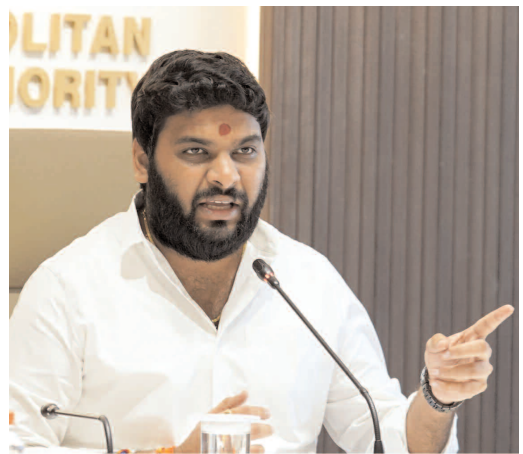
పెట్టుబడిదారులను భయపెట్టే ప్రయత్నం జరుగుతోందని అక్షేపించారు. జగన్ ప్రభుత్వం రూ. 2.66 లక్షల కోట్ల