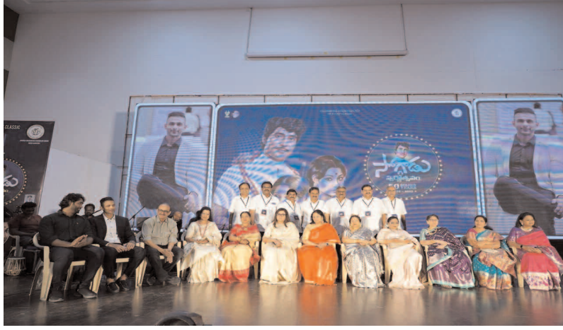
భీమవరం బీ (జయ జయపా)