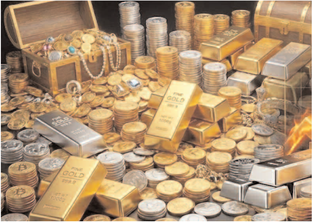
సరఫరాను భద్రపరచడమే కాకుండా, దేశీయ పరిశ్రమలకు అవుతుంది.

ఆధునిక పారిశ్రామిక యుగంలో వెండి కేవలం ఆభరణాల తయారీలో ఉపయోగించే లోహంగా పరిమితమైంది కాదు. ఇంధన మార్పిడులు, ఎలక్ట్రానిక్స్, వైద్య పరికరాలు, సోలార్ సాంకేతికత--ఈ అన్నింటికీ వెండి కీలక ముడిసరుకుగా మారింది. ఇటువంటి నేపథ్యంలో, గ్లోబల్ ట్రేడ్ రిసెర్చ్ ఇన్స్టిట్యూట్ తాజాగా విడుదల చేసిన గణాంకాలు భారత్ వెండి దిగుమతుల విధానంలో తక్షణం, సమగ్ర సంస్కరణలు అవసరమని స్పష్టంగా సూచిస్తున్నాయి. శుద్ధి చేసిన వెండిని నేరుగా దిగుమతి చేసుకోవడం ద్వారా విదేశీ మారక ద్రవ్యాన్ని విపరీతంగా వెచ్చిస్తున్న ప్రస్తుత విధానం ఆర్థికంగా దీర్ఘకాలికంగా స్థిరమైనది కాదు.