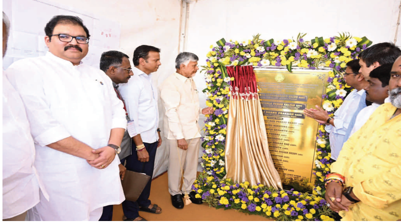
మొదటి పేజీ తరువాయి...

గ్రామీణ ప్రాంతాల్లో ఇ-ఆటోలు, ట్రై సైకిళ్లను అందుబాటులోకి తెచ్చామని, వ్యర్థాల నుంచి విద్యుత్ తయారు చేసే యూనిట్లను కూడా విస్తరిస్తున్నామని తెలిపారు.