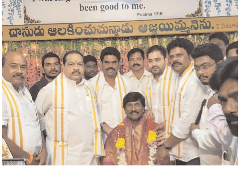
మాట్లాడుతూ జగన్మోహన్ రెడ్డి ముఖ్యమంత్రిగా ఉన్న కాలంలో క్రైస్తవులకు జరిగిన ఉపకారాన్ని తెలియజేశారు.