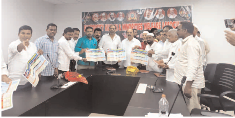
ఉద్యోగులకు సకాలంలో జీతాలు ఇచ్చేది కూటమి ప్రభుత్వం