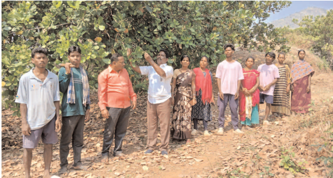
తెలిపారు. రైతులకు పెట్టుబడి ఖర్చులు కూడా రాక నష్ట పోతున్నారని అవేదన వ్యక్తం చేసారు. జీడి పిక్కల ధర ప్రభుత్వం శాస్త్రీయంగా నిర్ణయించి అమలు చేయక