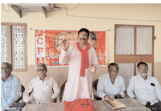
పడుతుందని ఆయన అన్నారు. ఈ మేరకు జనవరి 30న గ్రామాల్లో ప్రతిజ్ఞలు, సంతకాల సేకరణ, ఫిబ్రవరి 2న