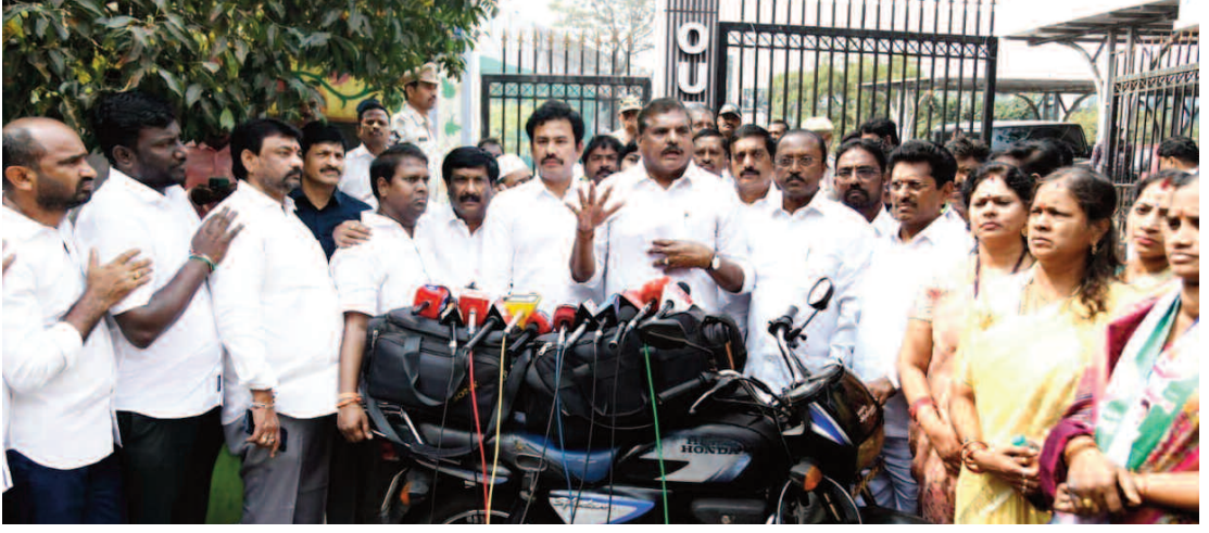
(విశాఖపట్టణం - జయజయహే)

విశాఖలో సీఎం చంద్రబాబు కుటుంబం భూదోపిడీకి పాల్పడుతోందని శాసనమండలి విపక్ష నేత బొత్త సత్యనారాయణ ఆగ్రహం వ్యక్తం చేశారు. లక్షలాది ఫీజులు వసూలు చేస్తూ...54.79 ఎకరాల ప్రభుత్వ భూమి కట్టా చేసిన గీతం విద్యాసంస్థలకు ఈ భూమిని అడ్డగోలుగా రెగ్యులరైజ్ చేయడానికి సిద్ధమైన ప్రభుత్వ తీరును తీవ్రంగా తప్పు పట్టారు. ప్రభుత్వం తన నిర్ణయాన్ని వెనక్కి తీసుకోవాలని డిమాండ్ చేస్తూ.. ఇవాళ వైయస్సార్సీపీ ఎమ్మెల్యేలు, కార్పొరేటర్లతో కలిసి విశాఖ జీవీఎంసీ కమిషనర్, మేయర్, మేయర్ లకి వినతిపత్రం సమర్పించారు. అనంతరం మీడియాతో మాట్లాడుతూ.. ప్రభుత్వం తన నిర్ణయాన్ని వెనక్కి తీసుకోకపోతే... రాజకీయ పార్టీలు, మేధావులతో కలిసి పోరాడతామని తేల్చి చెప్పారు. మరోవైపు కూటమిలో భాగస్వాములుగా ఉన్న బీజేపీ నేతలతో పాటు డిప్యూటీ సీఎం పవన్ కళ్యాణ్ కూడా దీనిపై స్పందించాలని డిమాండ్ చేశారు. విశాఖపట్టణంలో రూ.5వేల కోట్ల విలువైన 54.79 ఎకరాల ప్రభుత్వ భూమిని కట్టా చేసి.. దాన్ని రెగ్యులరైజ్ చేయడం ద్వారా ఎంపీ భరత్ చేస్తున్న భూదోపిడీకి వ్యతిరేకంగా వైయస్సార్ కాంగ్రెస్ పార్టీ ఆందోళనకు సిద్ధమైంది. దీనికోసం ఒక కార్యచరణ రూపొందించాం. అందులో భాగంగానే ఇవాళ విశాఖ జీవీఎంసీ మేయర్, కమిషనర్, ప్రిన్సిపల్ సెలెక్షన్ కమిషనర్లను సమర్పించి.. ముఖ్యమంత్రి చంద్రబాబు చేస్తున్న భూదోపిడీని ఆపాలని విజ్ఞప్తి చేశాం. గీతం విద్యాసంస్థల కట్టాలో ఉన్న ప్రభుత్వ భూమిని.. వారికి రెగ్యులరైజ్ చేసే ప్రతిపాదనను ఈ నెల 30 వ తేదీన జరగనున్న జీవీఎంసీ కౌన్సిల్ మీటింగ్ అజెండాలో పెట్టాల్దని కోరాం. నగరంలో మేధావుల పైతం ఈ భూదోపిడీని ..మిగతా 2లో