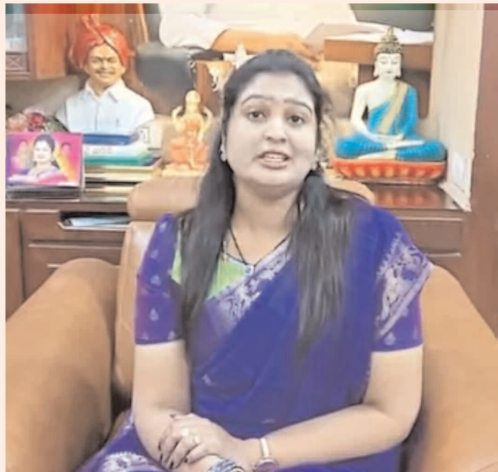
పోవడంతో వ్యాపారులు ఇష్టానుసారంగా వ్యవహరిస్తున్నారని తెలిపారు. జీడి రైతులను మోసగిస్తున్నారని తెలిపారు.