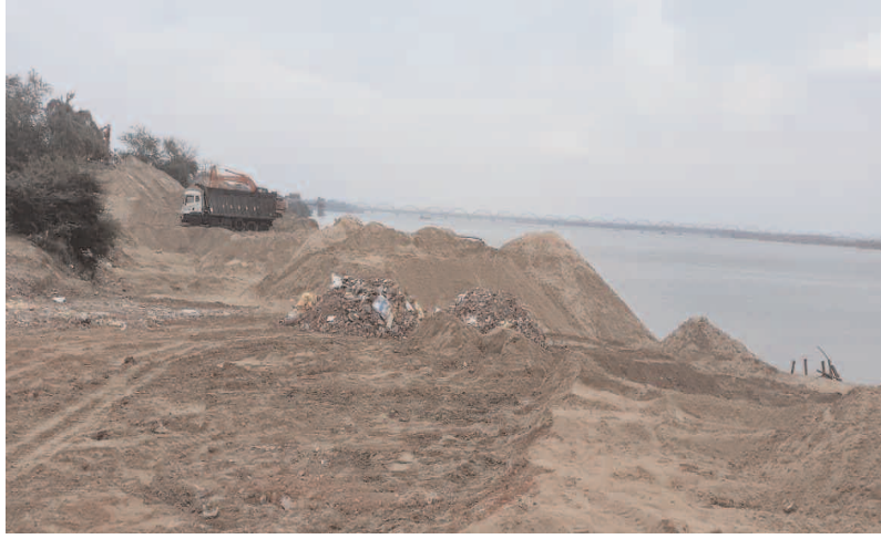
రాజమహేంద్రవరం, జయజయహే ప్రతినిధి:

రాజమహేంద్రవరం పరిసరాల్లో గోదావరి నదిలో ఇసుక అక్రమ తవ్వకాలు ఆగడం లేదు. ఓపెన్ రీచ్ లకు మాత్రమే పరిమితమవుతున్న తవ్వకాలు, నదీ తీరాన్ని అనుకుని ఉన్న దాదాపు అన్ని ర్యాంపులకూ విస్తరించడం తీవ్ర ఆందోళన కలిగిస్తోంది. కలెక్టర్ శిక్షణ కోసం