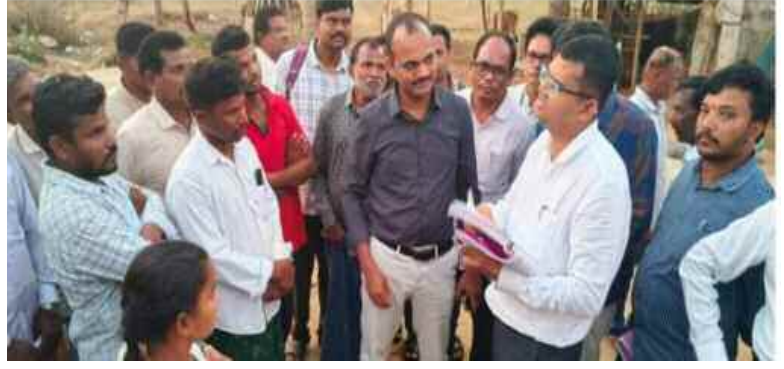
నందిగమం గ్రామాల్లో లో కలెక్టర్ పర్యటన

శ్రీకాకుళం జిల్లా నందిగమం మండలంలోని సుభద్రపురం, కొండ తెంబూరు, గ్రామాల్లో జిల్లా కలెక్టర్ స్వప్నికల్ దినకర్ పుండ్రం పర్యటించారు. రీ సర్వే అనంతరం రైతులకు అందజేసిన పట్టాదారు పాసు పుస్తకాల్లో ఎలాంటి తప్పిదాలు లేకుండా సంపూర్ణమైన ఖచ్చిత సమాచారంతో పట్టాదారు పాసు పుస్తకాలు రైతులకు పంపిణీ చేయాలని ఆయన అధికారులకు ఆదేశించారు. రైతుల పట్టాదారు పాస్ పుస్తకాల్లో భూపరిమితులు ఆధార్ ఫోన్ నెంబర్లు భూయజమాని పేర్లు, ఖచ్చితమైన సమాచారం ఉండేలా పరిశీలన చేయాలన్నారు. ఈ మేరకు రైతుల వద్దనున్న పట్టాదారు పాసు పుస్తకాల్లో ఉన్న వివరాలను చూసి రైతులకు అడిగి తెలుసుకున్నారు. రైతులు సంపూర్ణ వదేలా పాసుపుస్తకాలు పంపిణీ జరగాలని ఆదేశించారు. ఈ కార్యక్రమంలో టెక్నాలజీ ఆర్డీ ఎం కృష్ణమూర్తి, నందిగమం తహసీల్దార్ సిద్దిఖిద్ ది పాల్గొన్నారు.