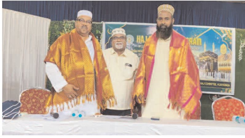
విశాఖపట్నం (జయ జయహే)

హాజ్ యాత్ర నియమాలు, ఆచారాలు వివరించిన ముఫ్తీలు యాత్రీకులకు కిట్లు, స్టీట్లు పంపిణీ.. ప్రముఖుల సత్కారం