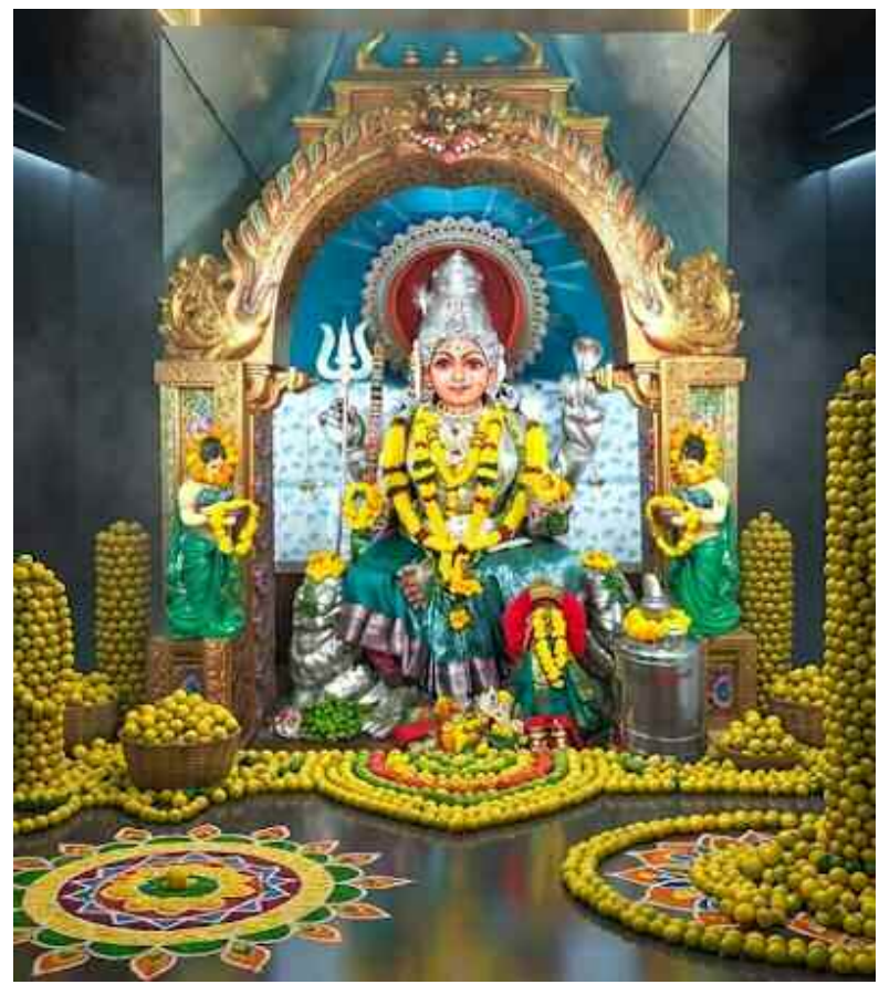
గుడిలో ఇచ్చే నిమ్మకాయ (ప్రసాదం)

తీసిన నిమ్మకాయలను మాల తీసిన తర్వాత ఆ నిమ్మకాయలు ఎవరి పాదాలకు తగలకుండా చూడాలి. వాటిని ప్రవహించే నీటిలో (కాలువ లేదా నది) కలపాలి. లేదా ఎవరూ తాక్కుని చోట, ఏదైనా చెట్టు మొదట్లో వేయాలి. దేవుడి మెడలో వేసిన నిమ్మకాయలను వంటల్లో వాడకూడదు, తినకూడదు. ఎందుకంటే అవి మీలోని నెగటివ్ ఎనర్జీని గ్రహించి ఉంటాయి. అమ్మవారి మెడలో వేసిన మాలలోని కాయలను బండికి కట్టకూడదు. కొత్తగా కోసిన నిమ్మకాయలను (దృష్టి కోసం) విడిగా బండికి కట్టకోవచ్చు.